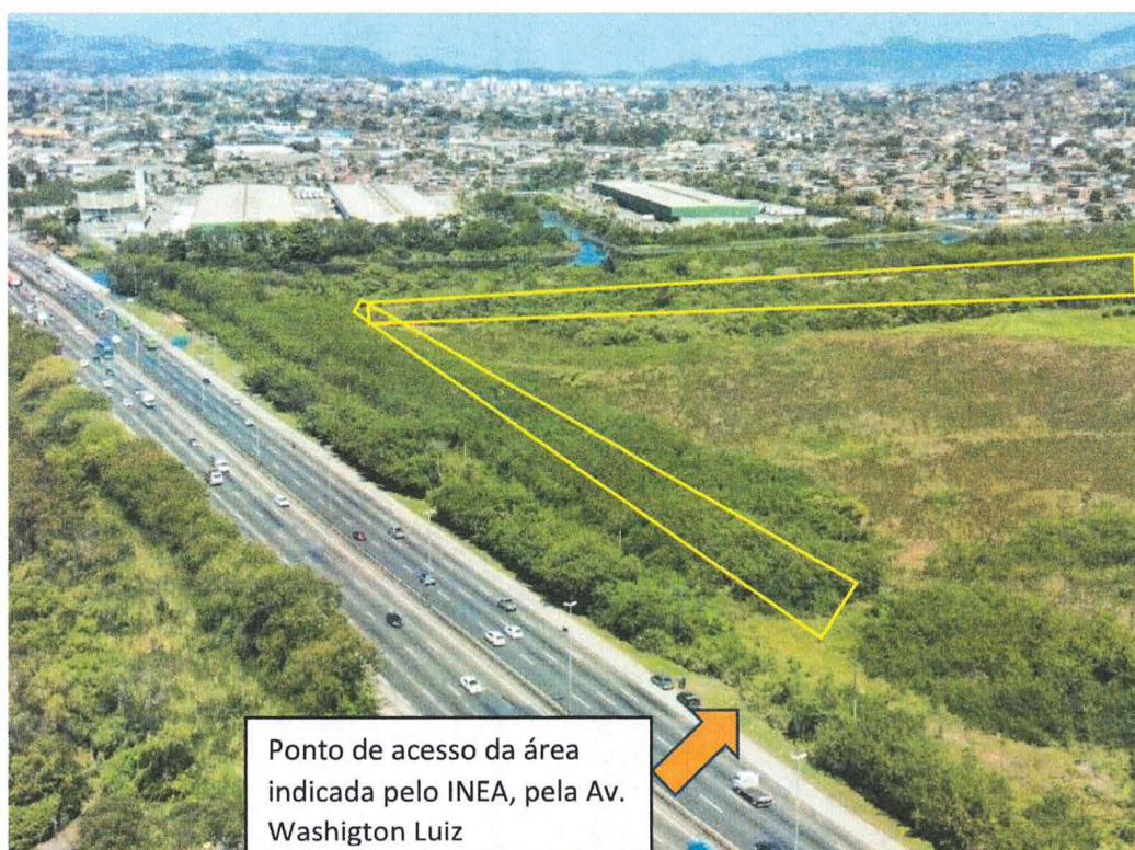
Figura 6 – Ponto de entrada da área que acessa a ecobarreira projetada