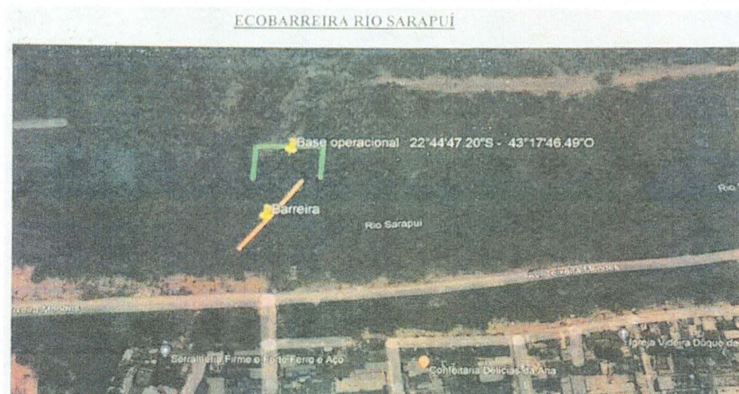
Figura 2 – Localização sugerida pelo INEA para ecobarreira do Rio Sarapuí

Localização da ecobarreira do Rio Sarapuí – Coordenadas 22°44'47,20\"S / 43°17'46,49\"O