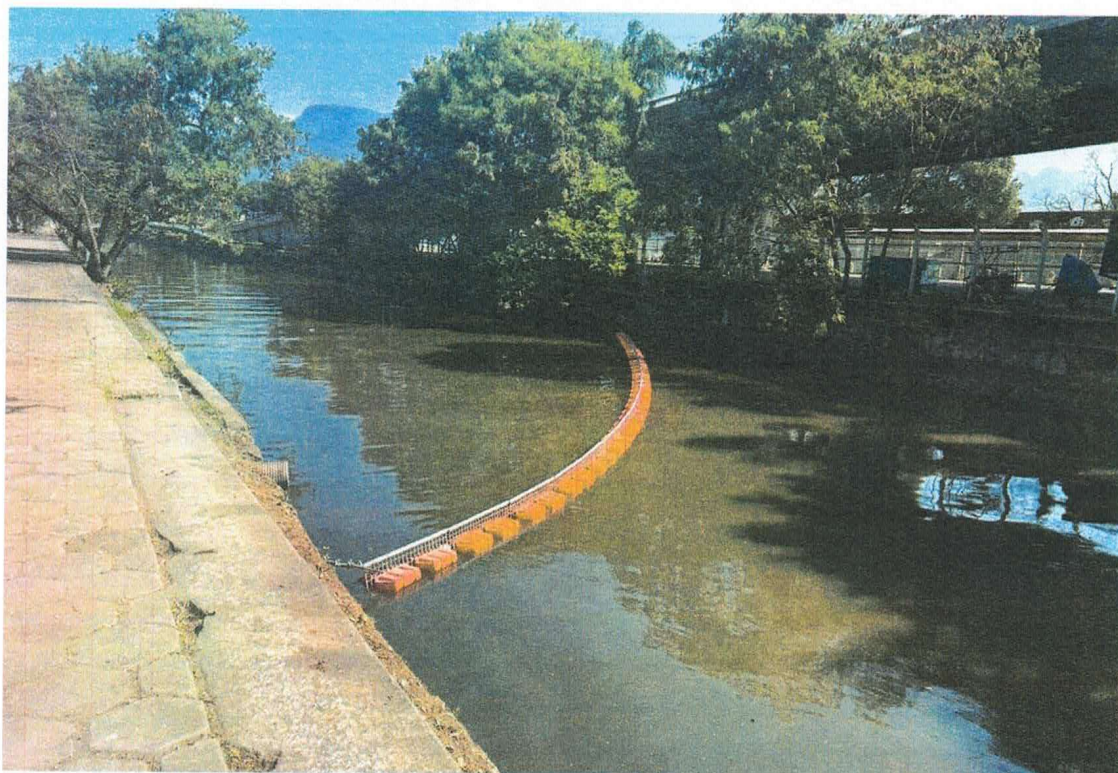
Figura 4 – ecobarreira metálica reinstalada no Canal do Mangue.

Contudo, informamos que não foi possível instalar a ecobarreira do Rio Sarapuí no local indicado pelo INEA neste referido ofício, tendo em vista as condições encontradas in loco , e abaixo explicadas.