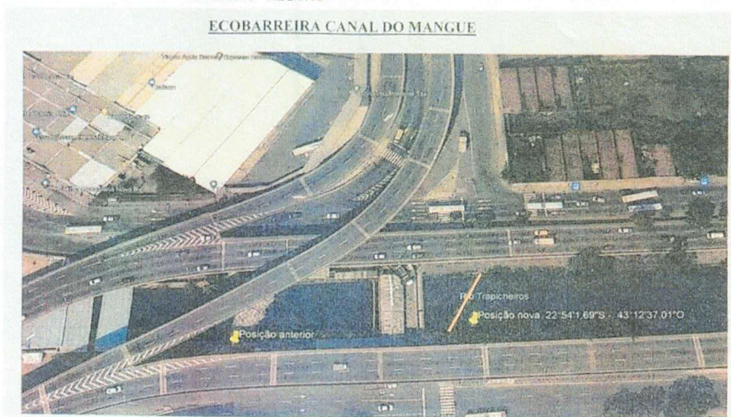
Figura 1 – Localização sugerida pelo INEA para ecobarreira do Canal do Mangue.

Localização da ecobarreira do Rio Sarapuí – Coordenadas 22°44'47,20\"S / 43°17'46,49\"O