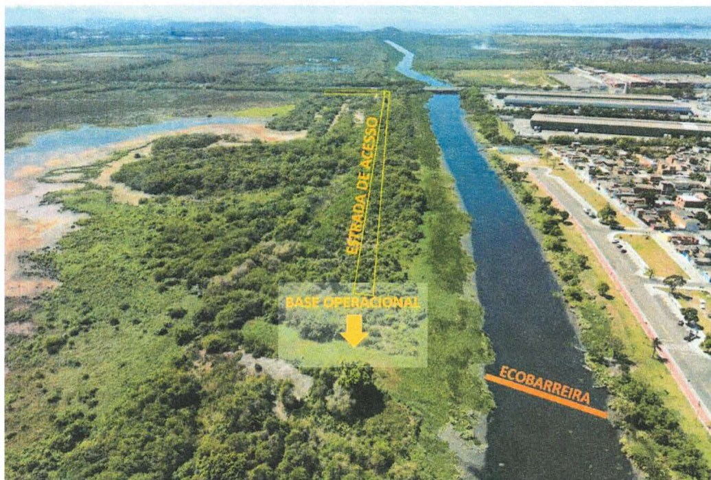
Figura 5 – localização da ecobarreira do Rio Sarapuí sugerida pelo INEA