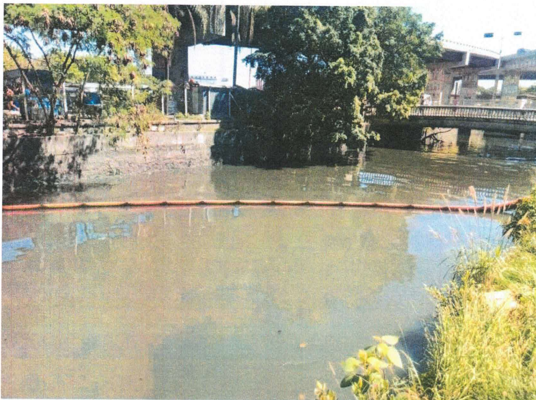
Figura 3 – ecobarreira termoplástica instalada no Canal do Mangue.

Ressalva-se, no entanto, que logo após sua instalação em conformidade com as especificações do edital, ou seja, constituída por material termoplástico, a equipe de fiscalização solicitou sua substituição por ecobarreira do tipo metálica.