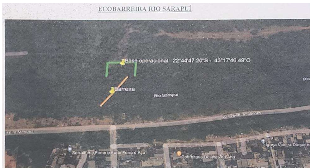
Figura 2 – Localização sugerida pelo INEA para ecobarreira do Rio Sarapuí

Contudo, como relatado pela Dimensional no dia 29.09.2023, através da carta DIM 00.229.005/2023 ( Anexo 02 ), a instalação da aludida ecobarreira resta-se prejudicada, em virtude de uma série de problemas que impossibilita a empresa alcançar o local de instalação.