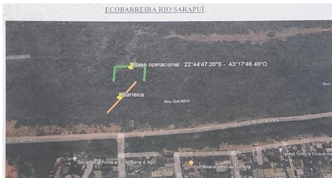
Figura 2 – Localização sugerida pelo INEA para ecobarreira do Rio Sarapuí

Localização da ecobarreira do Rio Sarapuí – Coordenadas 22°44'47,20\"S / 43°17'46,49\"O