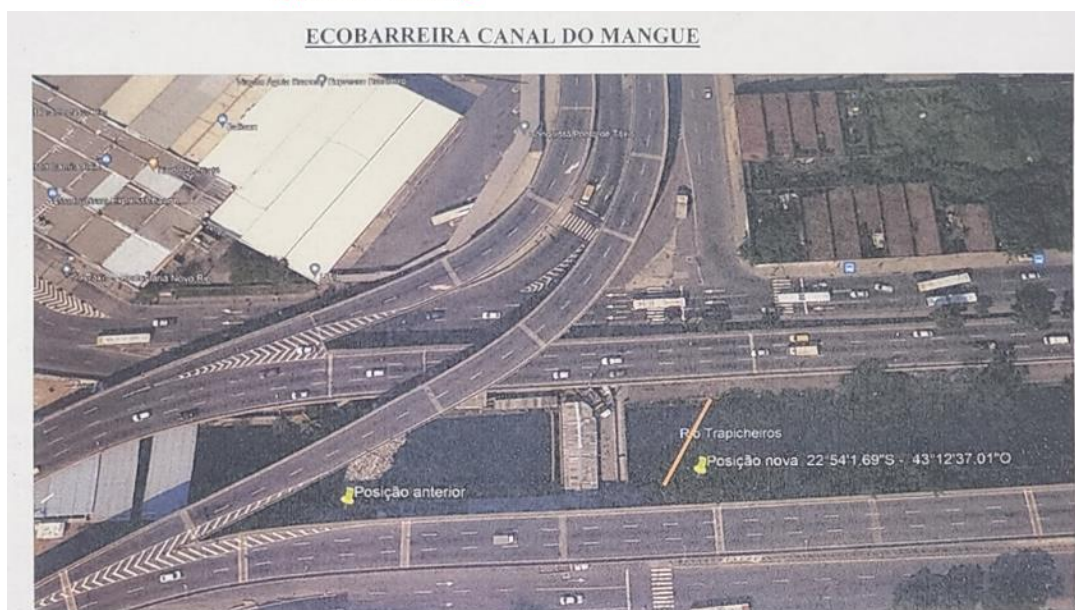
Figura 1 – Localização sugerida pelo INEA para ecobarreira do Canal do Mangue.

Localização da ecobarreira do Rio Sarapuí – Coordenadas 22°44'47,20\"S / 43°17'46,49\"O