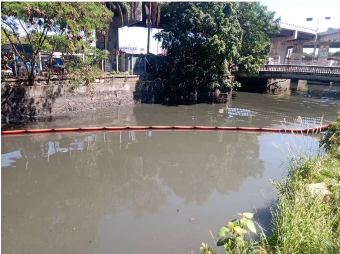
Figura 3 – ecobarreira termoplástica instalada no Canal do Manguê.

Ressalva-se, no entanto, que logo após sua instalação em conformidade com as especificações do edital, ou seja, constituída por material termoplástico, a equipe de fiscalização solicitou sua substituição por ecobarreira do tipo metálica.