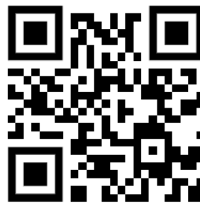
Rio Sarapuí – Vídeo 2