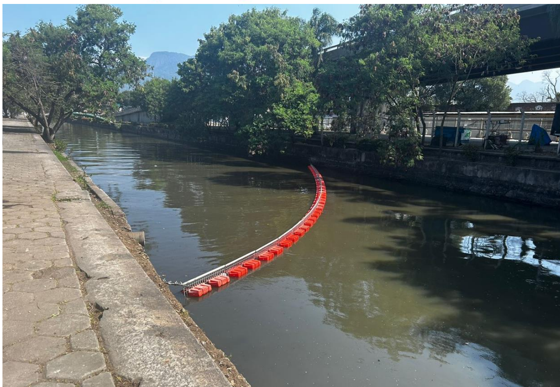
Figura 4 – ecobarreira metálica reinstalada no Canal do Mangue.

Contudo, informamos que não foi possível instalar a ecobarreira do Rio Sarapuí no local indicado pelo INEA neste referido ofício, tendo em vista as condições encontradas in loco , e abaixo explicadas.