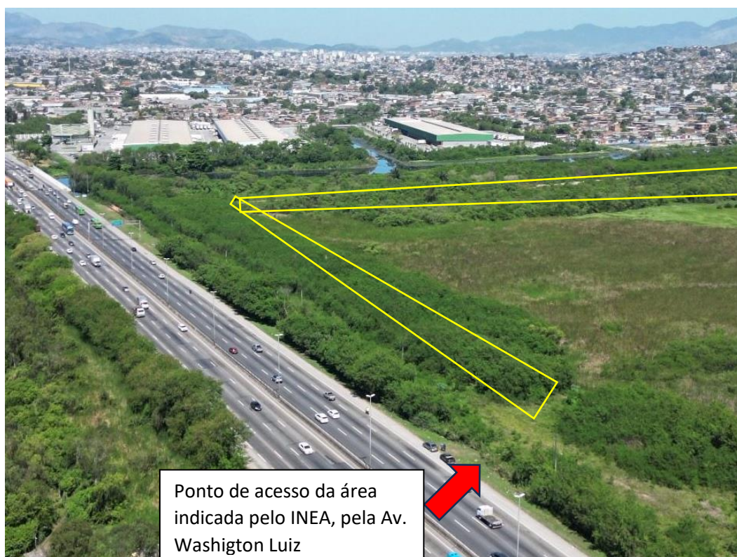
Figura 6 – Ponto de entrada da área que acessa a ecobarreira projetada