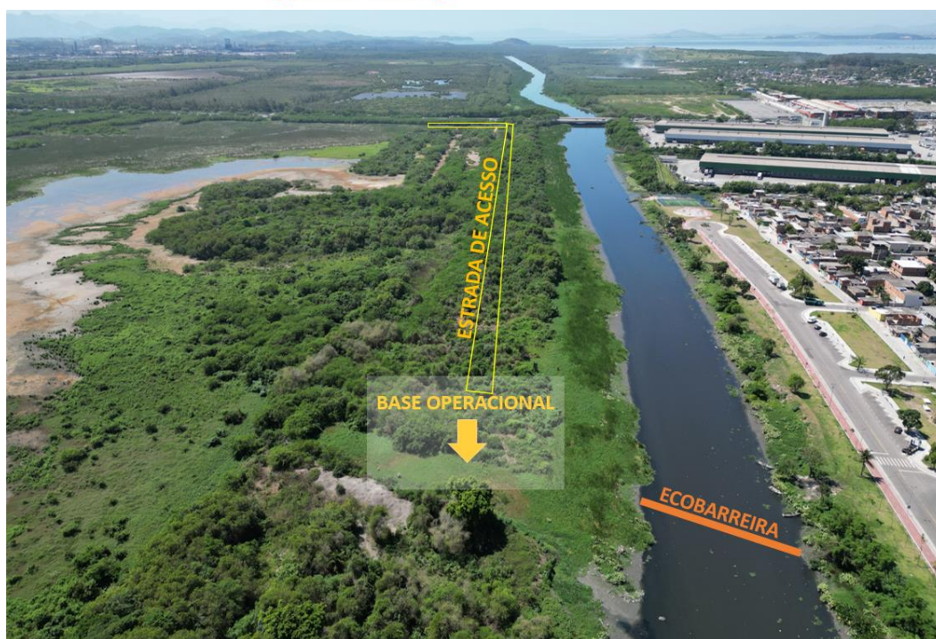
Figura 5 – localização da ecobarreira do Rio Sarapuí sugerida pelo INEA