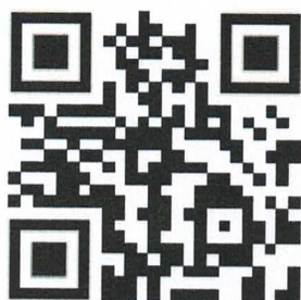
Rio Sarapuí – Vídeo 1