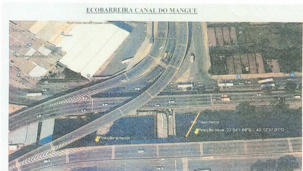
Figura 1 – Localização sugerida pelo INEA para ecobarreira do Canal do Mangue.

Localização da ecobarreira do Rio Sarapuí – Coordenadas 22°44'47,20\"S / 43°17'46,49\"O