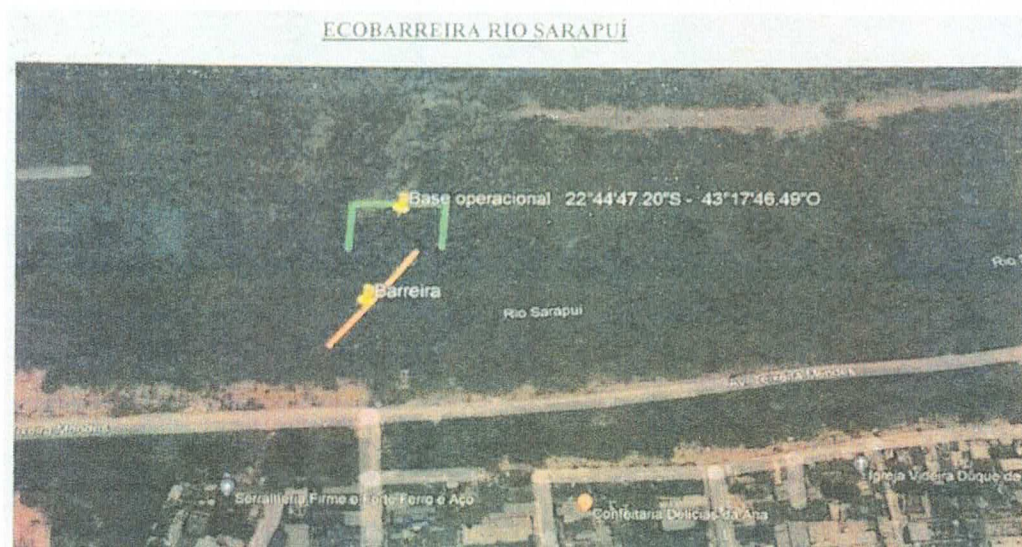
Figura 2 – Localização sugerida pelo INEA para ecobarreira do Rio Sarapuí

Localização da ecobarreira do Rio Sarapuí – Coordenadas 22°44'47,20\"S / 43°17'46,49\"O