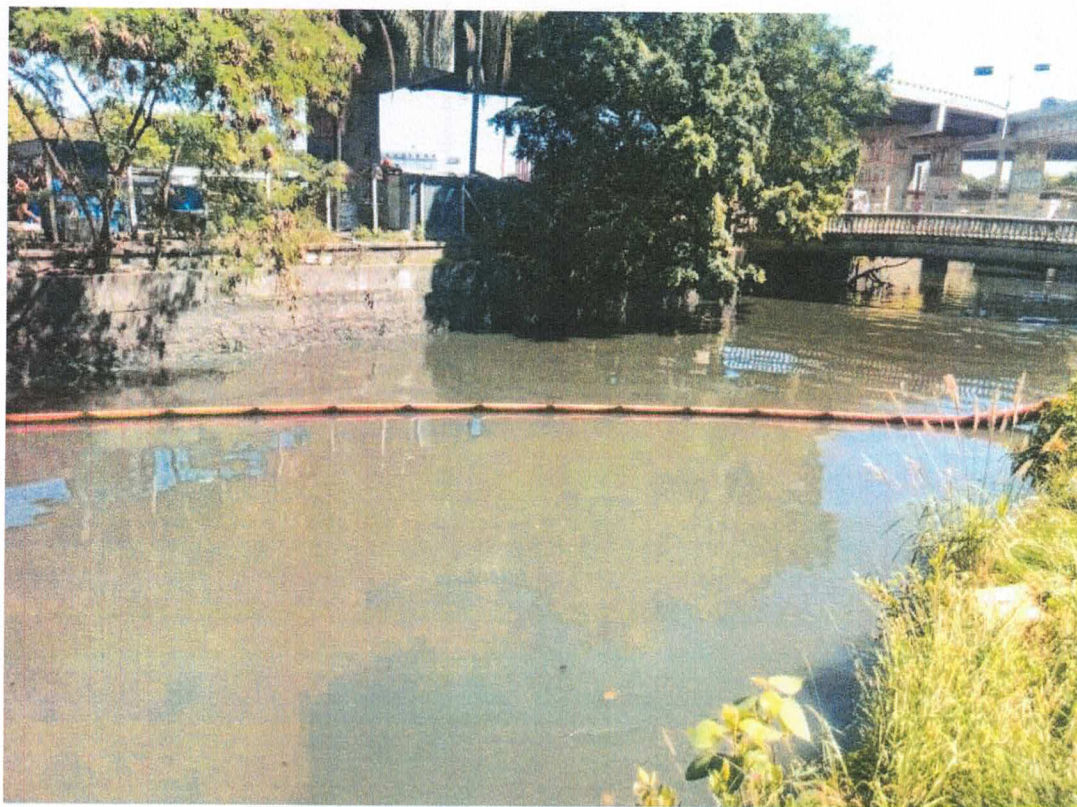
Figura 3 – ecobarreira termoplástica instalada no Canal do Mangue.

Ressalva-se, no entanto, que logo após sua instalação em conformidade com as especificações do edital, ou seja, constituída por material termoplástico, a equipe de fiscalização solicitou sua substituição por ecobarreira do tipo metálica.