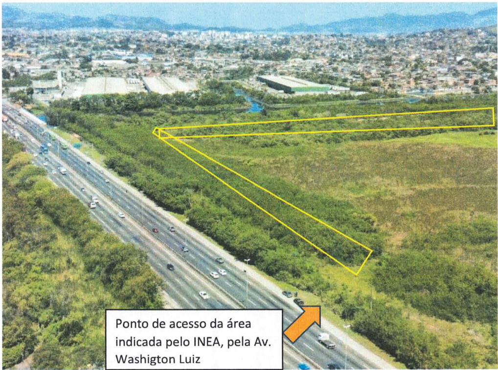
Figura 6 – Ponto de entrada da área que acessa a ecobarreira projetada