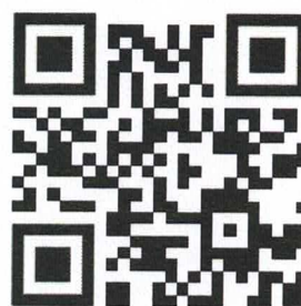
Rio Sarapuí – Vídeo 2