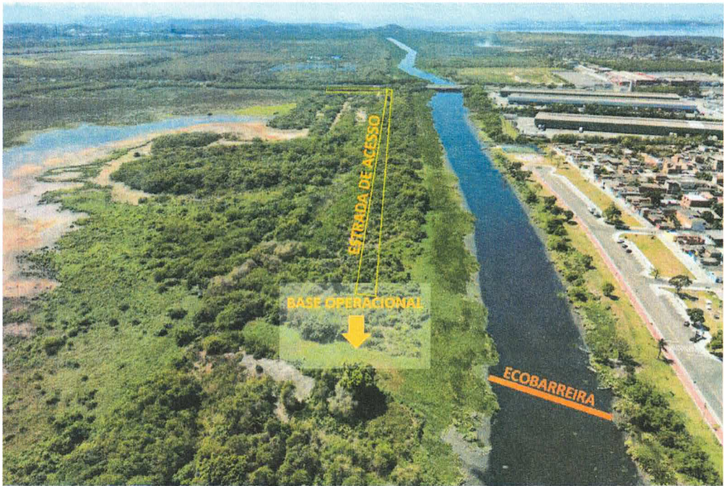
Figura 5 – localização da ecobarreira do Rio Sarapuí sugerida pelo INEA